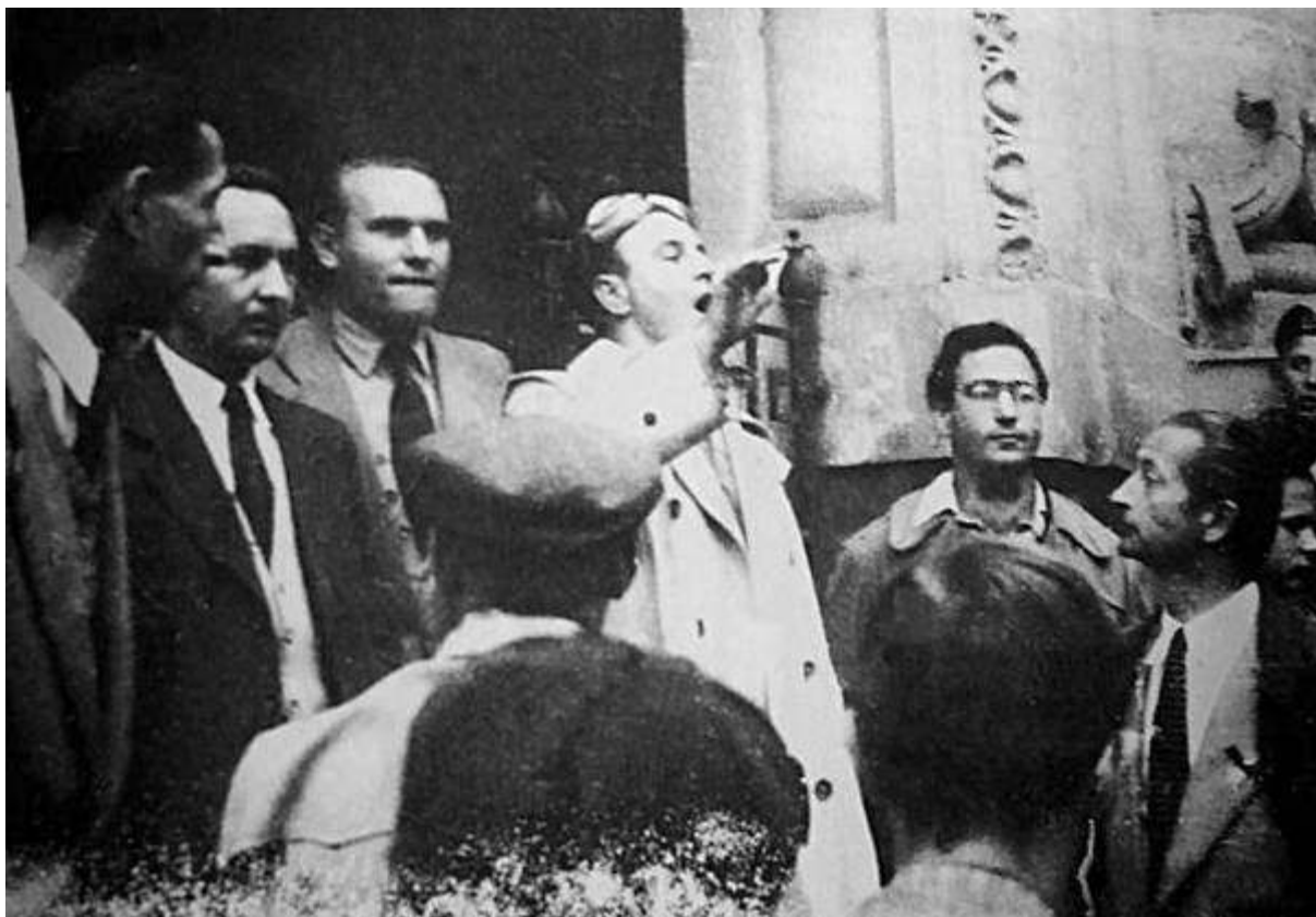
Gyűlés a győri pártbizottság épületénél. A szónok mellett a mártír rendező