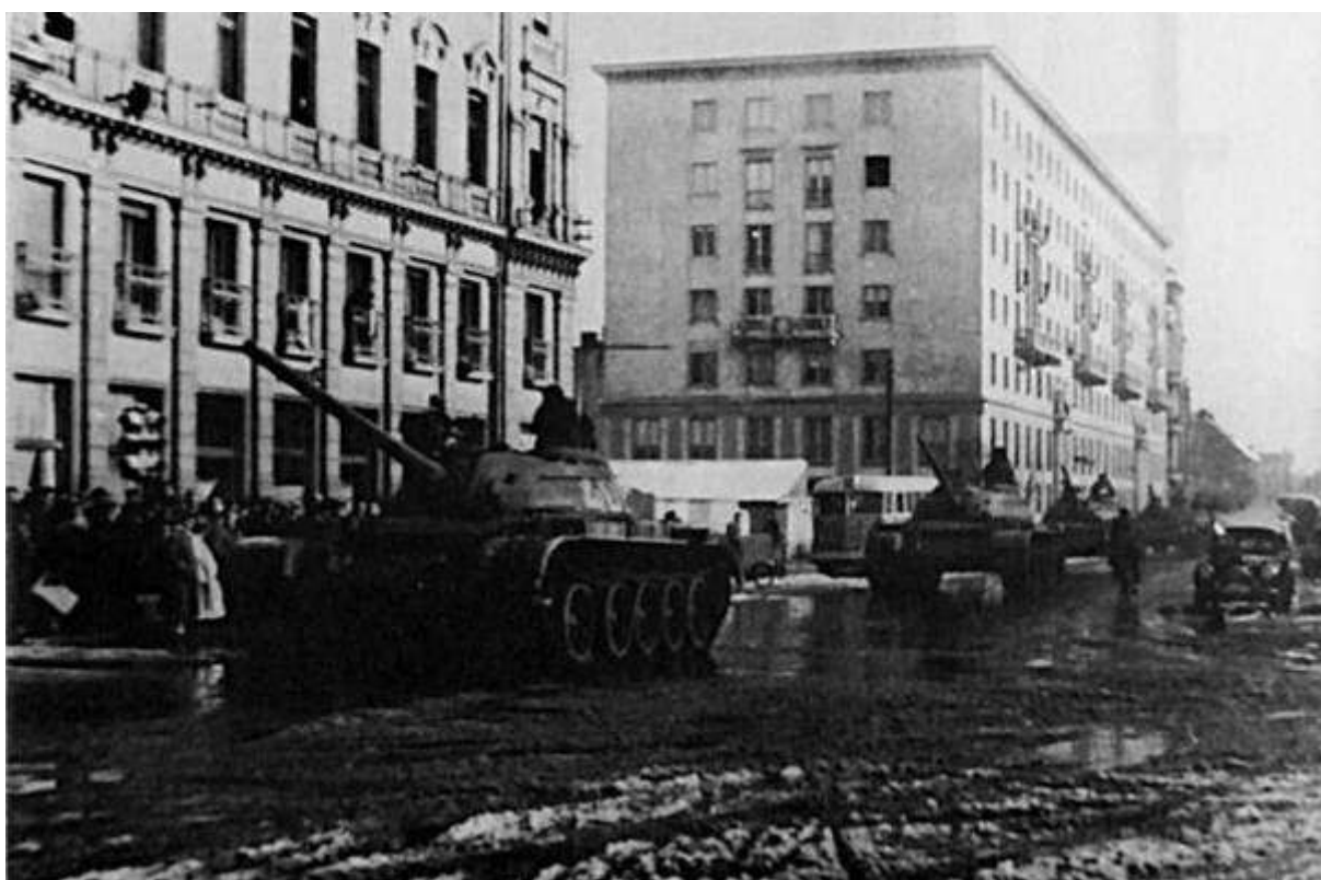
... és bejöttek a szovjet tankok. Győr, 1956. november 4.

Készült a Zalai Hírlap 2020. október 22-én megjelent cikke alapján. Szerző: Péter B. Árpád A képek : Családi képek, Dr. Szarka Lajos történész engedélyével